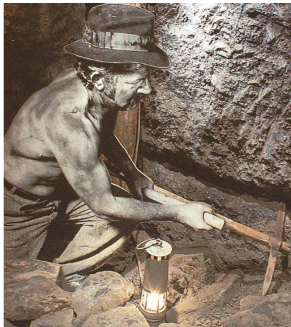
Piqueur Galerie reconstituée du Puits Couriot

Il travaille dans le chantier d'abattage : il abat le charbon et boise la taille à mesure qu'il avance.